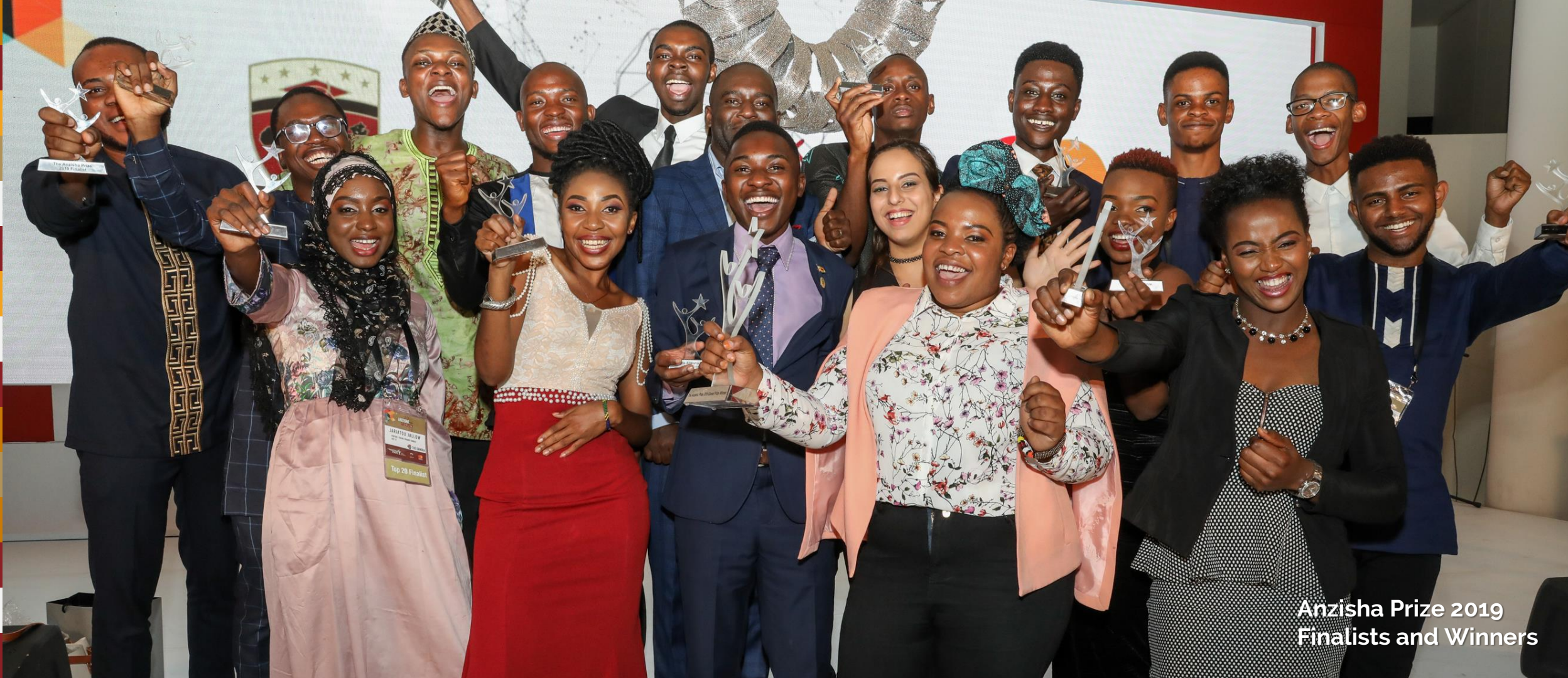
Anzisha Prize 2019 Finalists and Winners

Si vous complétez tous les critères et que vous avez toute la documentation en attente, vous êtes maintenant prêt à postuler. Le formulaire devrait prendre 30 à 45 minutes à remplir. Bonne chance !